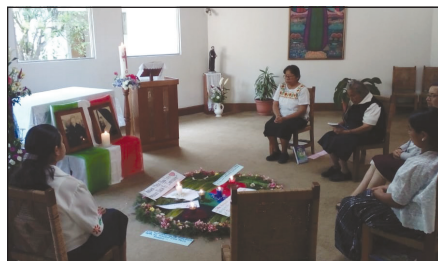
Las hermanas en aislamiento rezan por las familias afectadas por la pandemia.

Durante la pandemia hemos estado sintiendo el dolor de nuestros hermanos y hermanas que no tienen que comer, ni trabajo remunerado, o están sufriendo la pérdida de un ser querido que ha fallecido. No hemos tenido la oportunidad de acompañarlos cuando lo necesitan ni cuando tiene un entierro. Como misioneras hemos sido afectadas al no poder hacernos presentes ofreciendo los servicios en las aldeas que atendemos. No podemos estar al lado de la gente en su sufrimiento ni en su soledad. Hemos sido afectadas porque no estamos percibiendo ningún ingreso económico. Se ha notado mucho lo deficiente del sistema de salubridad y atención médica de nuestro pueblo. La ayuda que venía de la solidaridad nunca llegó. La gente ha sido evacuada de sus viviendas y las tierras de comunidades indígenas son invadidas una y otra vez. Oramos con fe y esperanza de que nuestro Padre Dios actúe en esta situación.