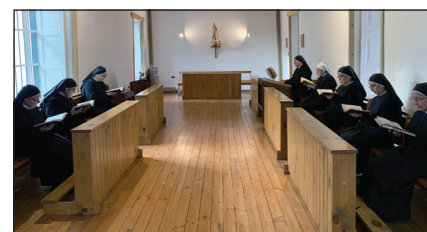
Las reflexiones cotidianas durante la pandemia son sobre el enriquecimiento espiritual y la vida fraternal.

Con la pandemia hemos aprendido a depender de otros para nuestras necesidades básicas, remedios, abastos y productos agropecuarios. En términos de nuestro trabajo hemos tenido que cerrar los talleres y la hospedería. Esto nos ha