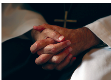
Oraciones para sanar.

Para nosotros la manera de ir encarando la pandemia ha sido un misterio, algo difícil de entender y expresar en palabras. Una quincena después de que se dieran los primeros casos del coronavirus cerramos la hospedería y la tienda.