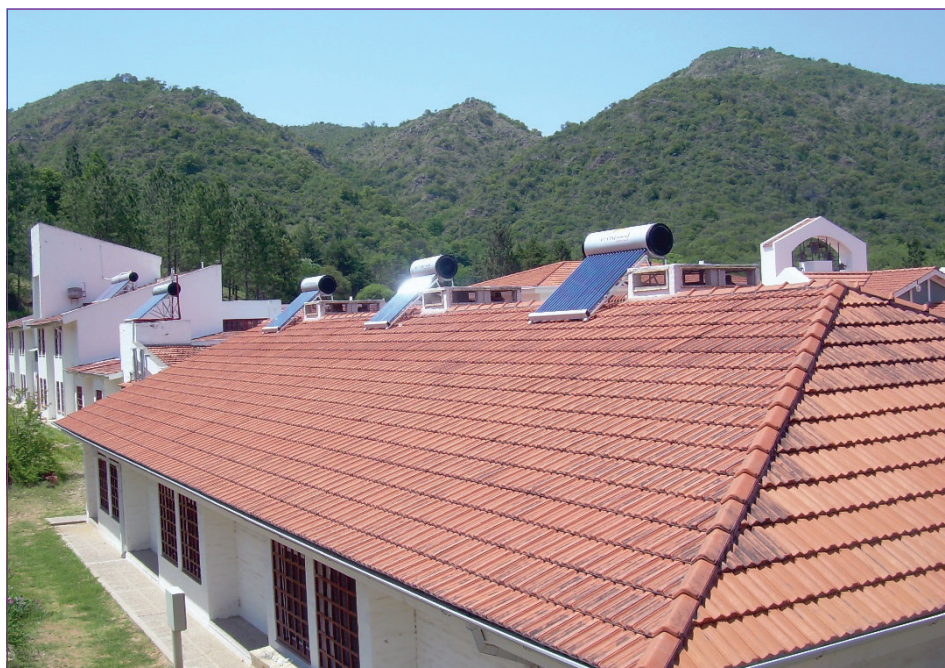
En los tejados del Monasterio: equipo colector de energía solar para agua sanitaria, lavandería, cocina y hostelería. Cielo limpio y azul claro.

Esperamos que ahora nos conozcan un poco mejor. Y para ustedes o aquellos que deseen visitarnos para conocernos mejor y aprovechemos los valores los unos de los otros: ¡vengan y vean!